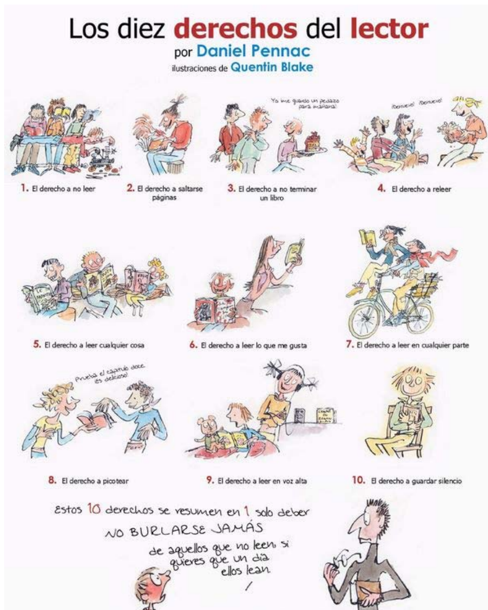
Fig. 1. Los 10 derechos del lector según Daniel Pennac, ilustrados por Quentin Blake.

tiene interiorizados los derechos imprescriptibles del lector que Daniel Pennac (2004) trata en su obra Como una novela y que, más recientemente, gracias a las ilustraciones de Quentin Blake se han hecho casi universales.