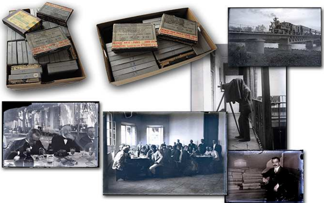
Archivo fotográfico de un profesional de prensa malagueño anónimo de principios del siglo XX procedente de un contenedor de basura