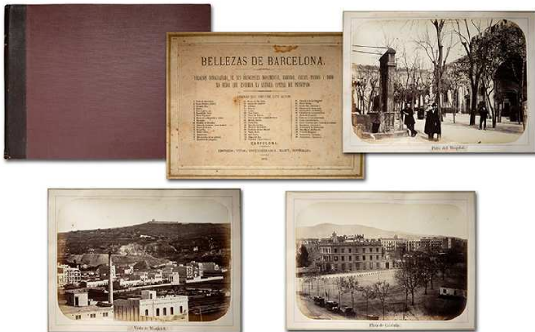
Álbum "Bellezas de Barcelona", realizado en 1874 por el fotógrafo Joan Martí