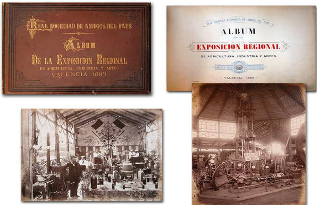
Álbum sobre la Exposición Regional de Valencia, realizado en 1883 por el fotógrafo Antonio García Peris para la Sociedad Económica de Amigos del País