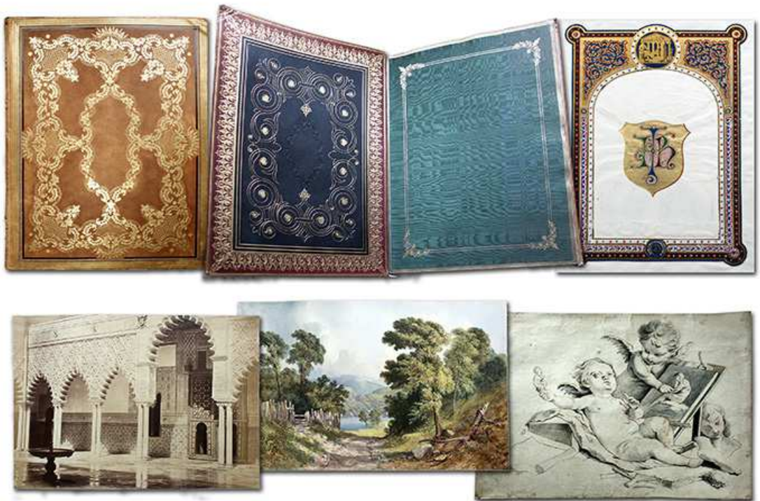
Álbum Pilkington. Fotografías, dibujos y acuarelas, en su mayor parte sobre España, fechado a mediados de la década de 1860