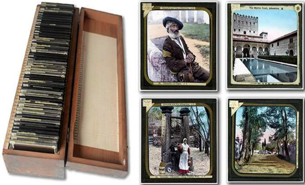
Placas de linterna mágica con fotografías coloreadas de Granda, por George W. Wilson y James Valentine