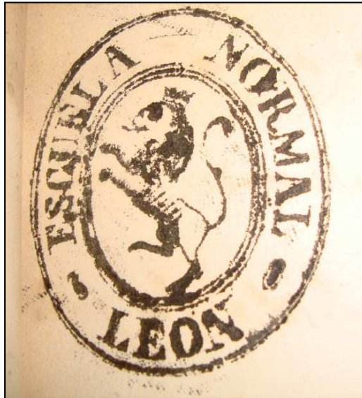
Ilustración 3. Primer sello de la Escuela Normal de León, corresponde al libro 1 de actas de exámenes.

centro por R.O. de 26 de abril de 1915". En 4 de junio de 1915 se empiezan a insertar las calificaciones estampadas en tinta. De igual modo en el curso 1916-1917 se celebran por primera vez los exámenes para obtener las matrículas de honor. En las actas del curso académico 1919-1920 se reúne el tribunal que habrá de juzgar la aptitud pedagógica de una maestra nacional "rehabilitada por R.O de 4 de agosto del corriente año".