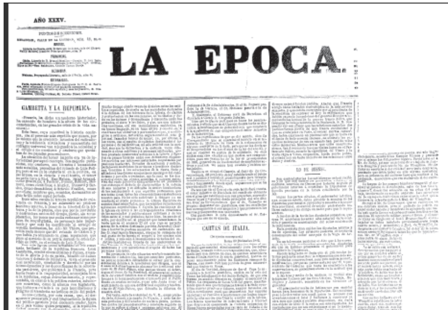
Fig. 2. Ejemplo de periódico mutilado