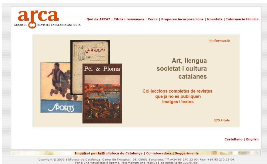
Fig. 1. ARCA ( Arxiu de Revistes Catalanes Antiques )

La BC ha focalitzat la seva política de digitalització en documents en situació de domini públic, que no tenen drets d'autor vigents; i d'acord amb els següents criteris de selecció: documents fràgils, documents singulars, documents amb interès per a la recerca, documents que presentin un estat físic adequat per a la manipulació i digitalització, documents que tinguin requeriments d'ús per a la consulta dels originals (p.e. les plaques de vidre fotogràfiques requereixen d'una taula de llum), documents que estiguin complets (especialment les publicacions en sèrie) i documents que siguin de consulta freqüent.