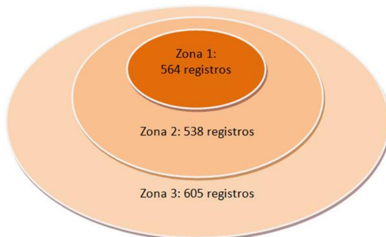
Ilustración 4: Modelo de Bradford aplicado para mostrar la dispersión de producción científica de la temática Caña de Azúcar (Fuente: elaboración propia).

La zona 1 o núcleo cuenta con 564 artículos, ocupa desde los registros de 114 hasta 12 y se corresponden con las revistas núcleo sumando un total de 21. Se establece esta zona debido a que, aunque el valor no alcanza la cifra de 569; si se adicionara los valores siguientes excedería en 61 al resultado definido a representar. La zona 2 cuenta con 538 artículos perteneciente a los valores de 11 hasta 3 artículos, estos pertenecen a un total de 113 revistas científicas. La zona 3 o periférica cuenta con 605 artículos, la misma representa todos los autores que tienen dos artículos o son autores transitorios (productividad de 1 registro), esta zona comprende un total de 507 revistas.