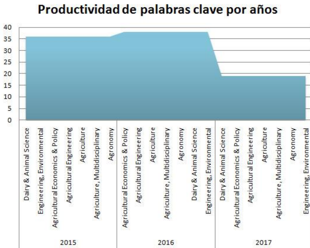
Ilustración 2: Palabras clave más productivas por años (Fuente: elaboración propia).

Se evidencia una coincidencia de palabras clave en todos los años analizados. Los términos refieren a las actuales temáticas de publicación de la revista y fundamentalmente a los aspectos que se relacionan con procesos químicos a partir de la caña de azúcar. Existen dentro de la UCLV una serie de instituciones cuyas investigaciones tributan a las áreas de investigación de la Revista Centro Azúcar. Las principales instituciones son: Departamento de Ingeniería Química, Departamento de Licenciatura en Química, Departamento de Farmacia, Centro de Bioactivos Químicos, Centro de Investigaciones de Química Aplicada, Centro de Biotecnología de las Plantas, Departamento de Ciencia Agropecuarias, Departamento de Ingeniería Agrícola.